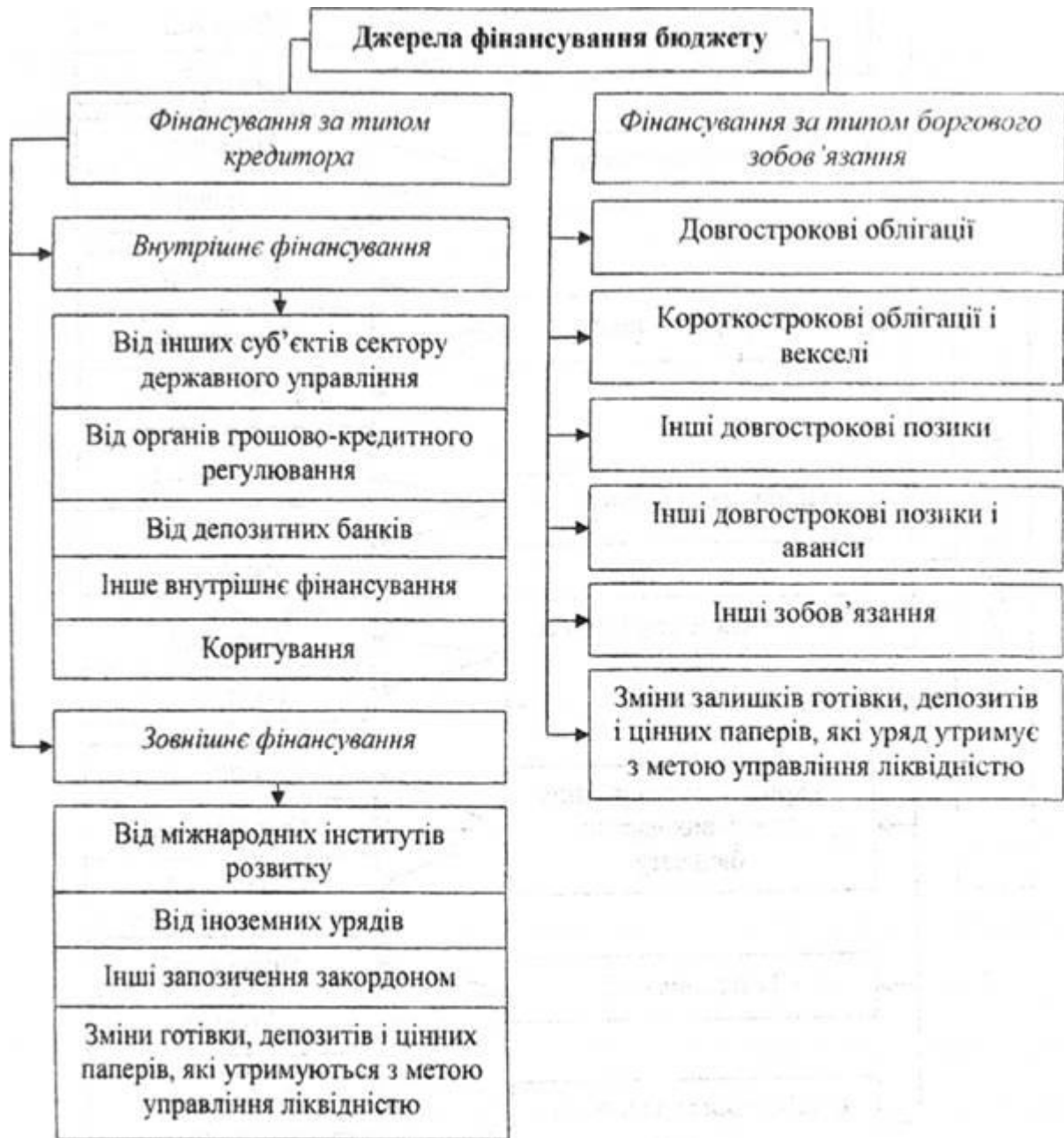
Рис. 2.10. Класифікація фінансування бюджету: підхід МВФ

Проблема дефіцитності бюджету є досить актуальною для України. Класичними напрямками скорочення дефіциту бюджету є збільшення доходів бюджету, зменшення його видаткової частини, зовнішні і внутрішні запозичення, емісійний дохід. Проте необхідно враховувати позитивні і негативні заходи застосування кожного з них та виробляти всередині кожного з цих інструментів ефективні заходи по стимулюванню зменшення дефіциту бюджету в Україні.