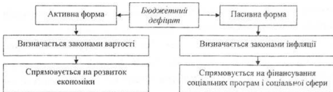
Рис. 2.7. Економічна сутність бюджетного дефіциту

Таким чином, бюджетний дефіцит є одним із макроекономічних показників, який характеризує економічний розвиток країни, її стійкість, економічну безпеку, та визначає його роль у системі державного регулювання.