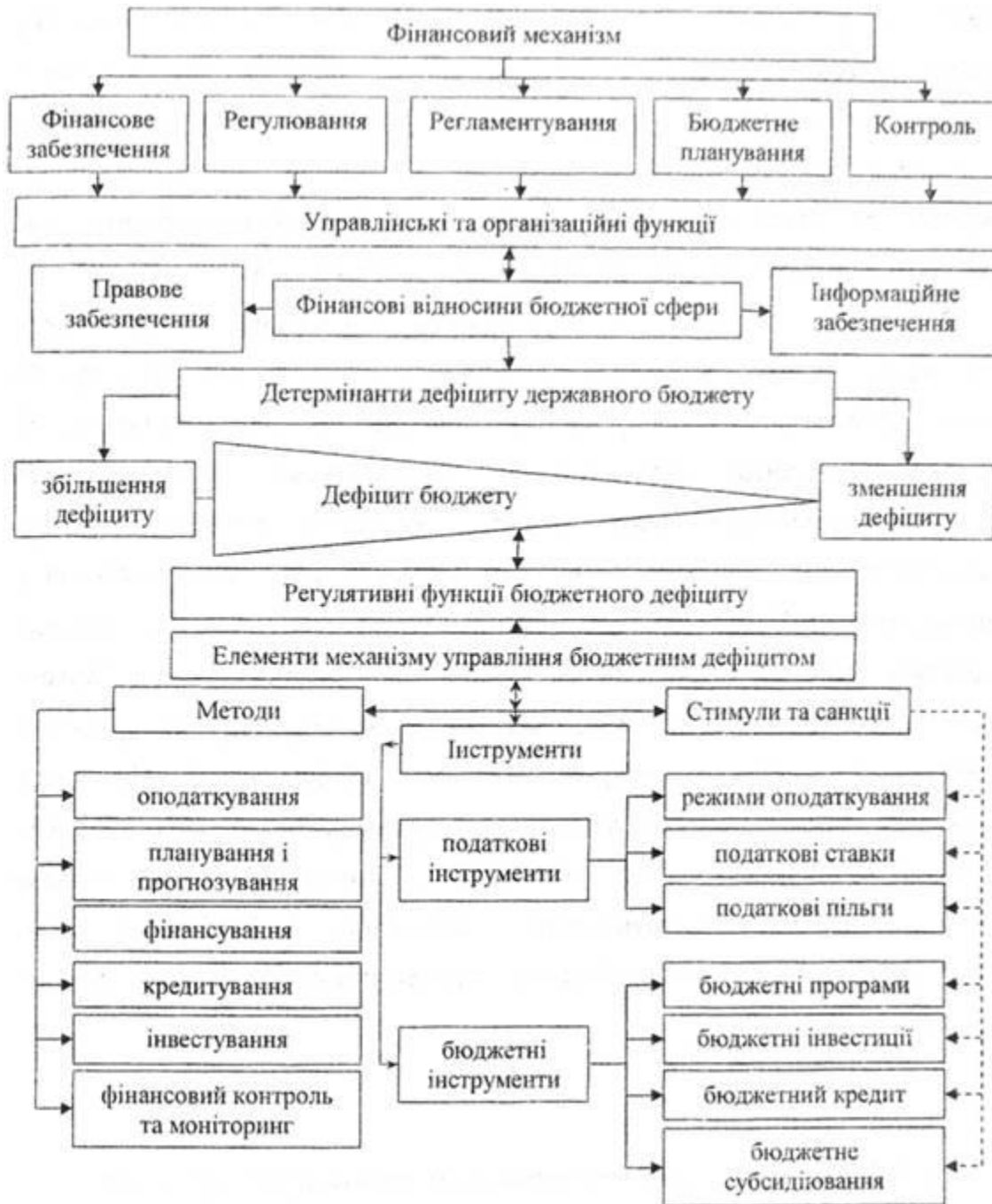
Рис. 2.11. Схема фінансового механізму управління бюджетним дефіцитом

Скорочення обсягів бюджетного дефіциту насамперед пов'язане з удосконаленням системи доходів бюджету та механізму їхньої мобілізації. На загальнодержавному рівні доцільно модернізувати структуру доходів бюджету. Основними напрямками зміцнення доходної бази бюджетів могли б бути: