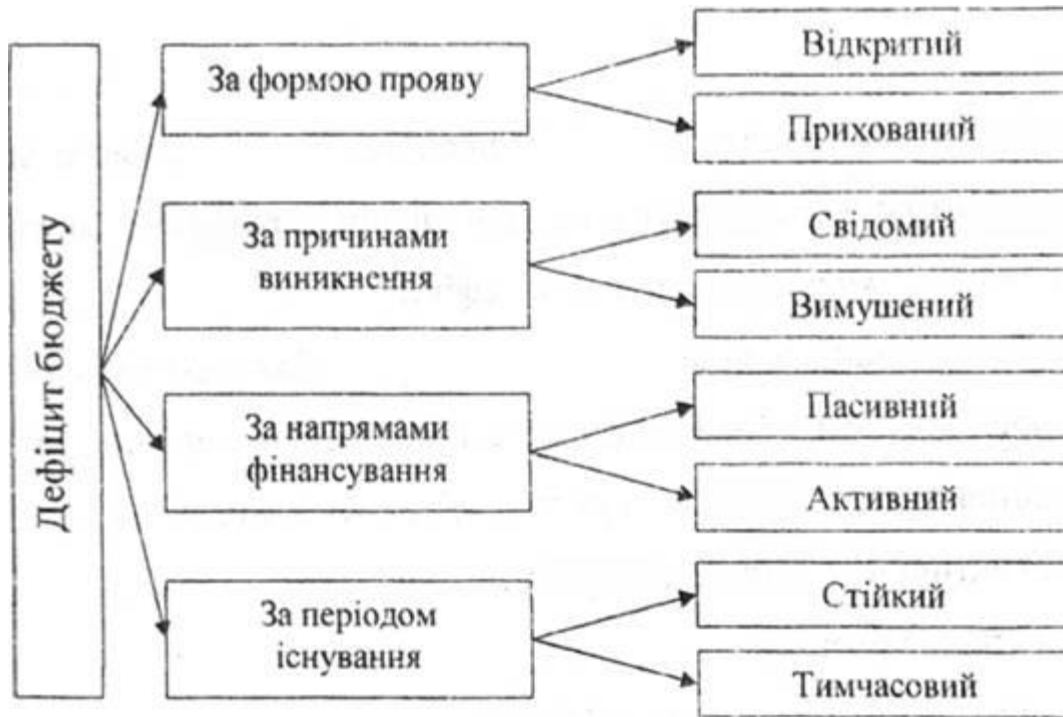
Рис. 2.8. Основні класифікаційні ознаки видів бюджетного дефіциту

В Україні граничний розмір дефіциту державного бюджету встановлюється Верховною Радою України під час затвердження закону про державний бюджет на наступний рік.