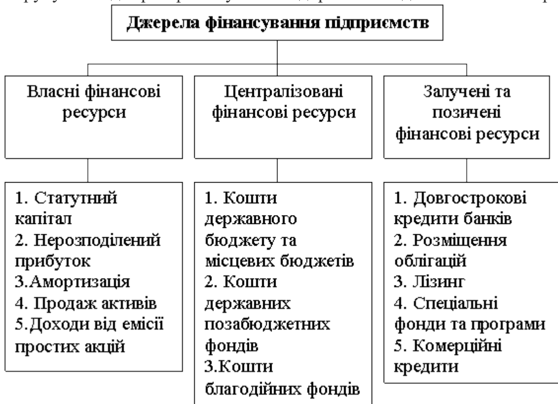
Рис. 1. Джерела фінансування підприємств

Групування джерел фінансування підприємства здійснено нами на рис.1.